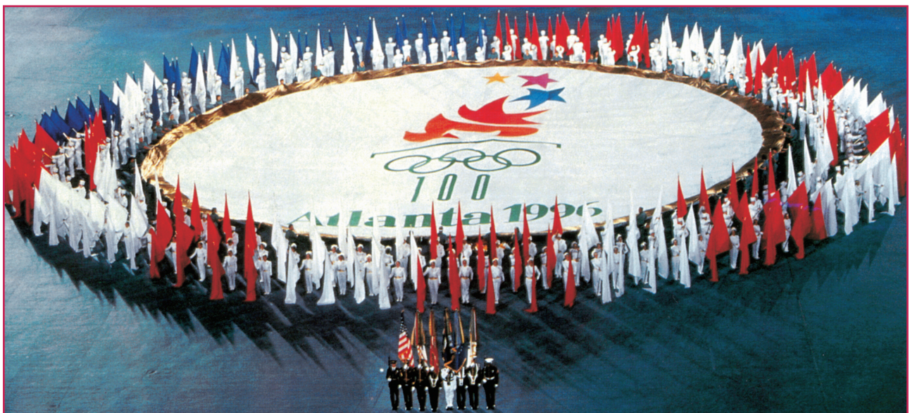
La cerimonia di apertura delle Olimpiadi di Atlanta 1996, avvenuta all'insegna di Martin Luther King e del suo messaggio "I have a dream", mentre l'ex pugile Cassius Clay accendeva la fiamma olimpica.

Episodi certo eclatanti, specchio di una mentalità che non voleva riconoscere il mutamento della concezione dello sport, da passatempo per pochi abbienti a professione più o meno remunerata per molti.