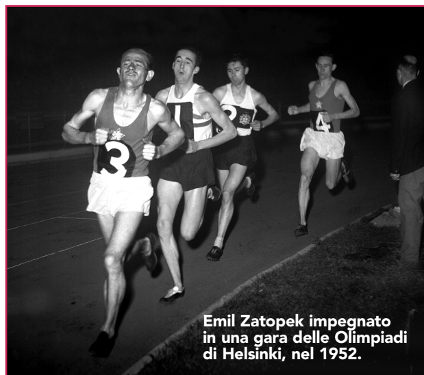
Emil Zatopek impegnato in una gara delle Olimpiadi di Helsinki, nel 1952.

Anche le prime Olimpiadi australiane, disputate a Melbourne nel 1956, ebbero le loro difficoltà politiche: furono infatti disertate da Egitto, Libano e Iraq, che intendevano in questo modo protestare contro l'invasione del Sinai da parte delle truppe israeliane e contro i bombardamenti effettuati da Francia e Inghilterra, intervenute contro la nazionalizzazione del canale di Suez compiuta dal premier egiziano Nasser. In questa edizione si registrarono altri due boicottaggi, da parte dell'Olanda e della Spagna, che non accettava-