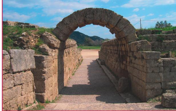
I resti della porta d'accesso all'antico stadio di Olimpia.

Dei tre ceti che formavano la società feudale – la nobiltà, il clero e la plebe – la sola interessata a praticare attività fisica con carattere "sportivo" era evidentemente la prima. La nobiltà , cui spettavano i compiti militari, necessitava infatti di un allenamento costante, incentrato sulla preparazione militare , che veniva praticato non da atleti propriamente detti, ma da compo-