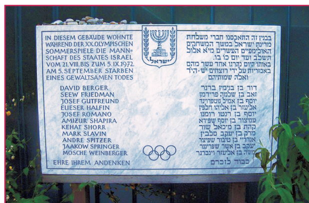
Stele commemorativa della strage di Monaco, 1972.

I difficili rapporti tra la Cina popolare e Taiwan riemersero, vent'anni dopo Melbourne, durante le Olimpiadi di Montreal del 1976. Taiwan infatti pretese di sfilare dietro il cartello "Republic of China", richiesta del tutto inaccettabile per la Cina popolare, che pose una drammatica alternativa. A sostegno di Taiwan si schierarono gli Stati Uniti, che giunsero a minacciare addirittura un clamoroso ritiro dall'Olimpiade, se Taiwan non fosse stata ammessa. Alla fine prevalse la decisione imposta dal Canada, che, non riconoscendo Taiwan, di fatto la esclude dall'Olimpiade, in nome della ragion di stato, che esigeva che venissero mantenuti rapporti commerciali con la Cina popolare.