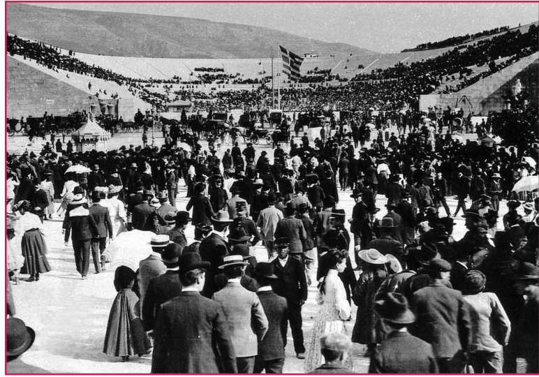
Atene 1896: lo stadio delle prime Olimpiadi dell'era moderna.

Il celebre motto "l'importante non è vincere, ma partecipare" sarà presto dimenticato nei fatti, in quanto i soli atleti ricordati sono e saranno sempre e comunque i vincitori, ma diventerà uno slogan di grande importanza ideologica. Le masse degli spettatori avrebbero dovuto guardare allo sport olimpico come a un momento di distacco ideale dalla società e dai suoi valori mercantilistici. Lo sport doveva essere un momento di sana e disinteressata partecipazione collettiva, contro i valori sempre più esasperati e conflittuali della società occidentale di fine Ottocen-