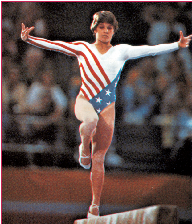
Los Angeles, 1984: una ginnasta alla trave.

Il primo vero boicottaggio avvenne in realtà già durante i giochi di Montreal del 1976, perché tutti i paesi africani (tranne Costa d'Avorio e Senegal) si ritirarono a causa della presenza della Nuova Zelanda, responsabile d'intrattenere rapporti con il Sud Africa, già escluso dal CIO per la sua politica razzista.