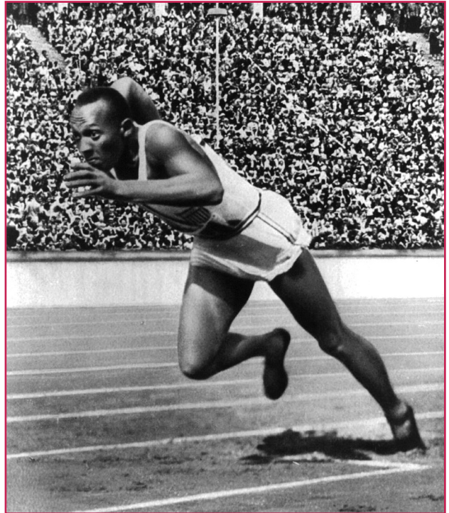
Jesse Owens, che a Berlino nel 1936 vinse ben quattro ori olimpici.

Le Olimpiadi del 1936 introdussero anche significativi cambiamenti organizzativi. Videro per la prima volta la creazione del villaggio olimpico , iniziativa destinata a ripetersi nelle successive edizioni. Nel villaggio, edificato appositamente per la manifestazione, venivano riuniti atleti, tecnici e accompagnatori. Furono anche le prime Olimpiadi che videro l'intervento massiccio dello Stato, poi ripetutosi regolarmente, a dimostrazione che il significato politico e propagandistico, di prestigio internazionale, attribuito allo sport non rimase esclusivo del regime nazista.