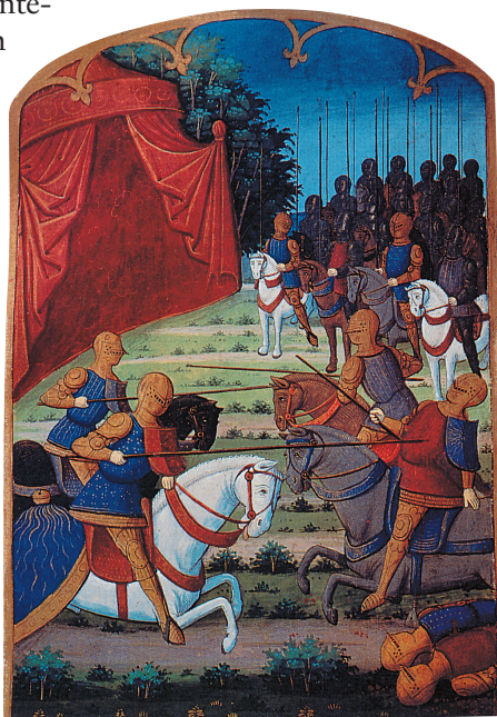
Rappresentazione di uno scontro tra cavalieri durante un torneo.

Il calcio fiorentino , spesso citato come esempio di sport rinascimentale e cittadino, era soprattutto una grande festa popolare, eredità diretta dello spirito carnevalesco medievale. Stesso discorso vale per il palio , una forma di competizione spettacolare che ancora è presente ai nostri giorni, nella quale le differenze fra le classi venivano rimarcate anche fra il pubblico che assisteva da postazioni nettamente separate.