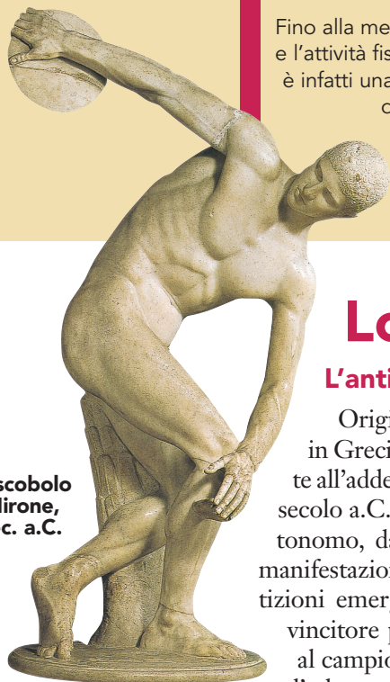
Il discobolo di Mirone, V sec. a.C.

Ma se potessimo tornare indietro di 2500 anni circa, in Grecia, potremmo osservare che per più di un aspetto il fenomeno sportivo presentava una forma abbastanza vicina alla nostra.