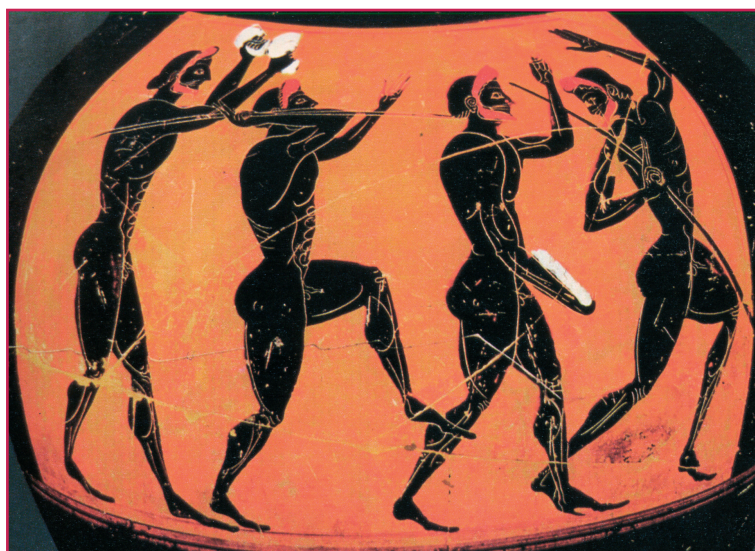
Antico vaso greco su cui sono raffigurati alcuni atleti partecipanti a una gara di pentathlon, impegnati nelle diverse discipline.

Ancora, lo sport era un fenomeno economico rilevante, attorno al quale circolava molto denaro, per mantenere gli atleti, per allenarli, per ingaggiarli e anche per le scommesse.