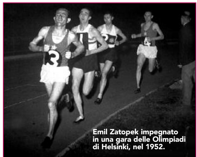
Emil Zatopek impegnato in una gara delle Olimpiadi di Helsinki, nel 1952.

Anche le prime Olimpiadi australiane, disputate a Melbourne nel 1956, ebbero le loro difficoltà politiche: furono infatti disertate da Egitto, Libano e Iraq, che intendevano in questo modo protestare contro l'invasione del Sinai da parte delle truppe israeliane e contro i bombardamenti effettuati da Francia e Inghilterra, intervenute contro la nazionalizzazione del canale di Suez compiuta dal premier egiziano Nasser. In questa edizione si registrarono altri due boicottaggi, da