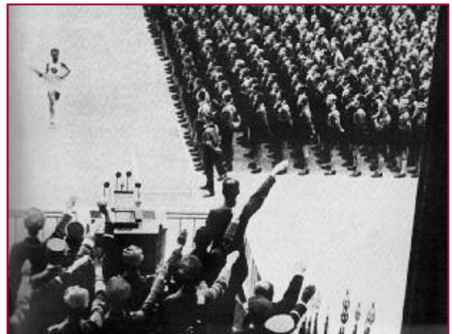
L'ultimo tedoforo entra nello stadio di Berlino, nel 1936, sotto gli occhi di Hitler.

Al momento della conquista del potere, nel 1933, il regime nazista iniziò immediatamente a organizzare lo sport giovanile, attribuendogli una precisa finalità politica. Allo sport spettava il compito di «esibire la forza e il carattere della razza ariana» (Guido Panico).