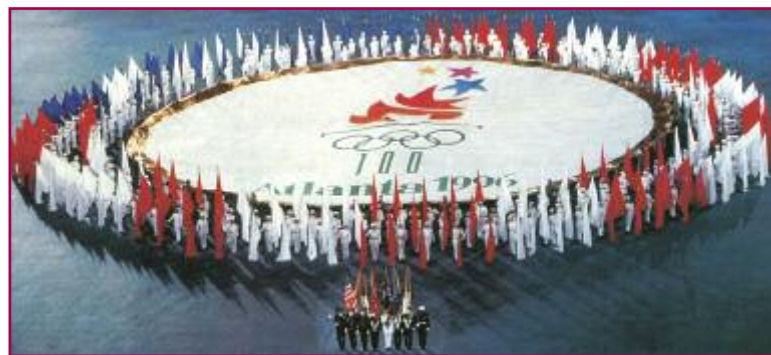
La cerimonia di apertura delle Olimpiadi di Atlanta 1996, avvenuta all'insegna di Martin Luther King e del suo messaggio "I have a dream", mentre l'ex pugile Cassius Clay accendeva la fiamma olimpica.

In verità, nelle Olimpiadi moderne gli atleti fecero