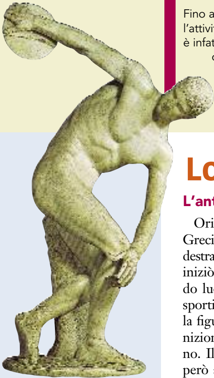
Il discobolo di Mirone, V sec. a.C.

Il modello costituito dallo sport greco non si riprodusse nella civiltà della Roma antica , dedita a una forma di intrattenimento che puntava su un tipo di competizione più spettacolare che puramente sportiva. Nelle arene e nei circhi delle grandi città romane, infatti, si svolgevano non so-