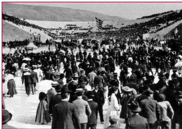
Atene 1896: lo stadio delle prime Olimpiadi dell'era moderna.

In primo luogo si trattava di proporre lo sport come grande "medicina" sociale, un motivo interna-