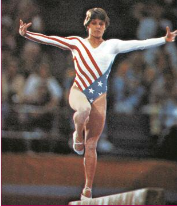
Los Angeles, 1984: una ginnasta alla trave.

partecipazione degli atleti statunitensi e russi era di tale rilievo, che la loro assenza privò di interesse tecnico entrambe le manifestazioni.