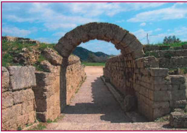
I resti della porta d'accesso all'antico stadio di Olimpia.

lo combattimenti più o meno cruenti (fra lottatori, gladiatori e talvolta con animali feroci), ma anche e soprattutto corse di bighe, circhi, battaglie navali ecc.