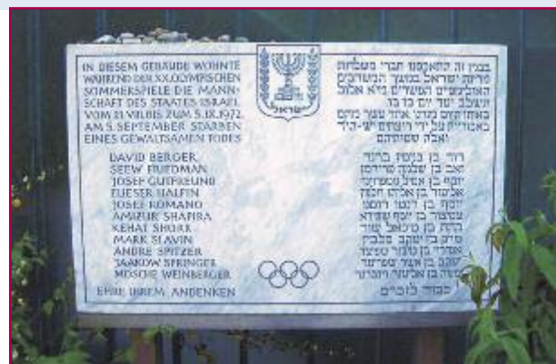
Stele commemorativa della strage di Monaco, 1972.

I difficili rapporti tra la Cina popolare e Taiwan riemersero, vent'anni dopo Melbourne, durante le Olimpiadi di Montreal del 1976. Taiwan infatti pretese di sfilare dietro il cartello "Republic of China", richiesta del tutto inaccettabile per la Cina popolare, che pose una drammatica alternativa. A sostegno di Taiwan si schierarono gli Stati Uniti, che giunsero a minacciare addirittura un clamoroso ritiro dall'Olimpiade, se Taiwan non fosse stata ammessa. Alla fine prevalse la decisione imposta dal Canada, che, non riconoscendo Taiwan, di fatto la esclude dall'Olimpiade, in nome della ragion di stato, che esigeva che venissero man-